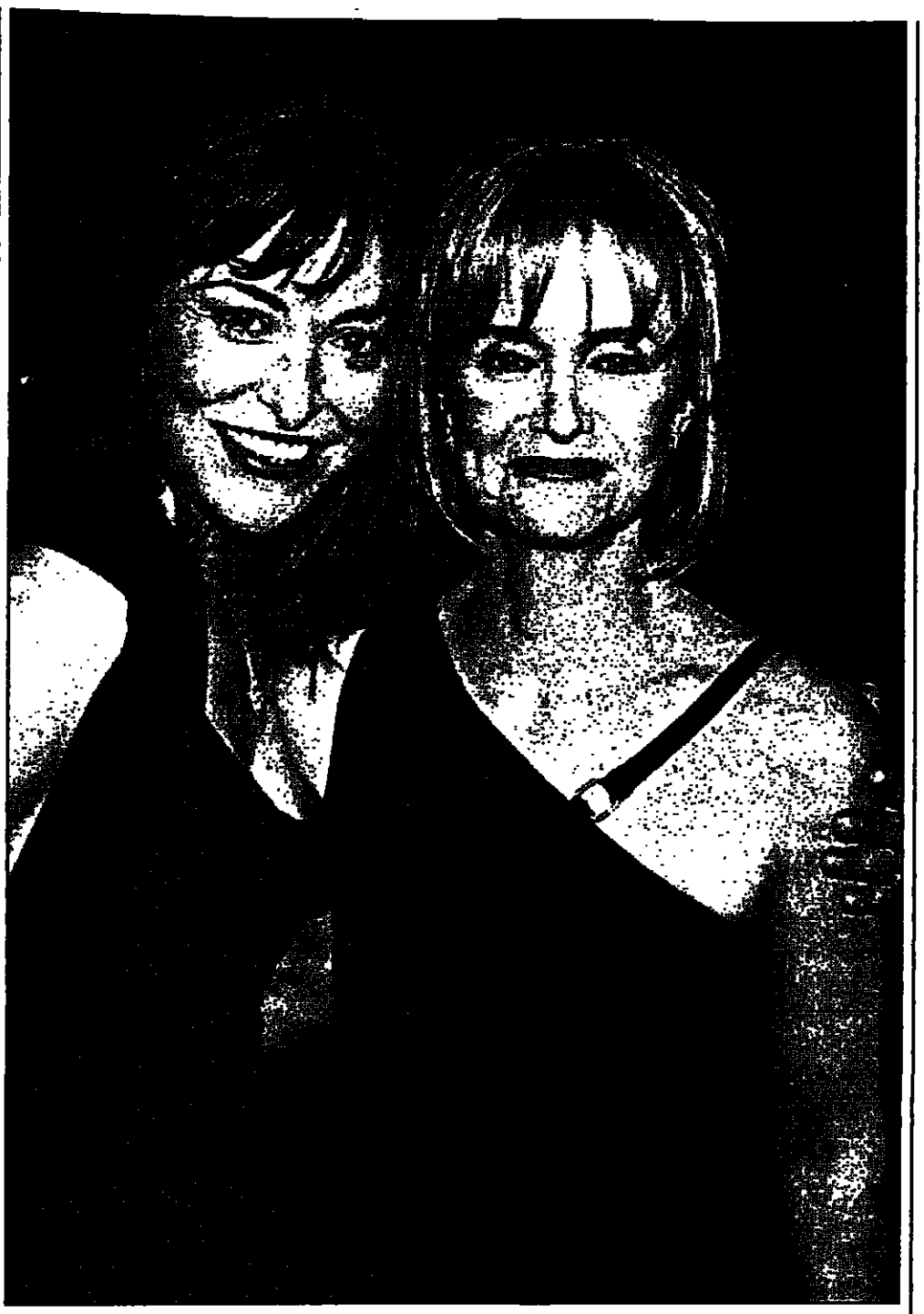
النجمة البريطانية أماتا دونوه (الى اليسار) مع النجمة سوسي كيرتز لدى وصولهما لمعمل العرض الأول للفيلم كلاب كاتب، في لوس انجلوس